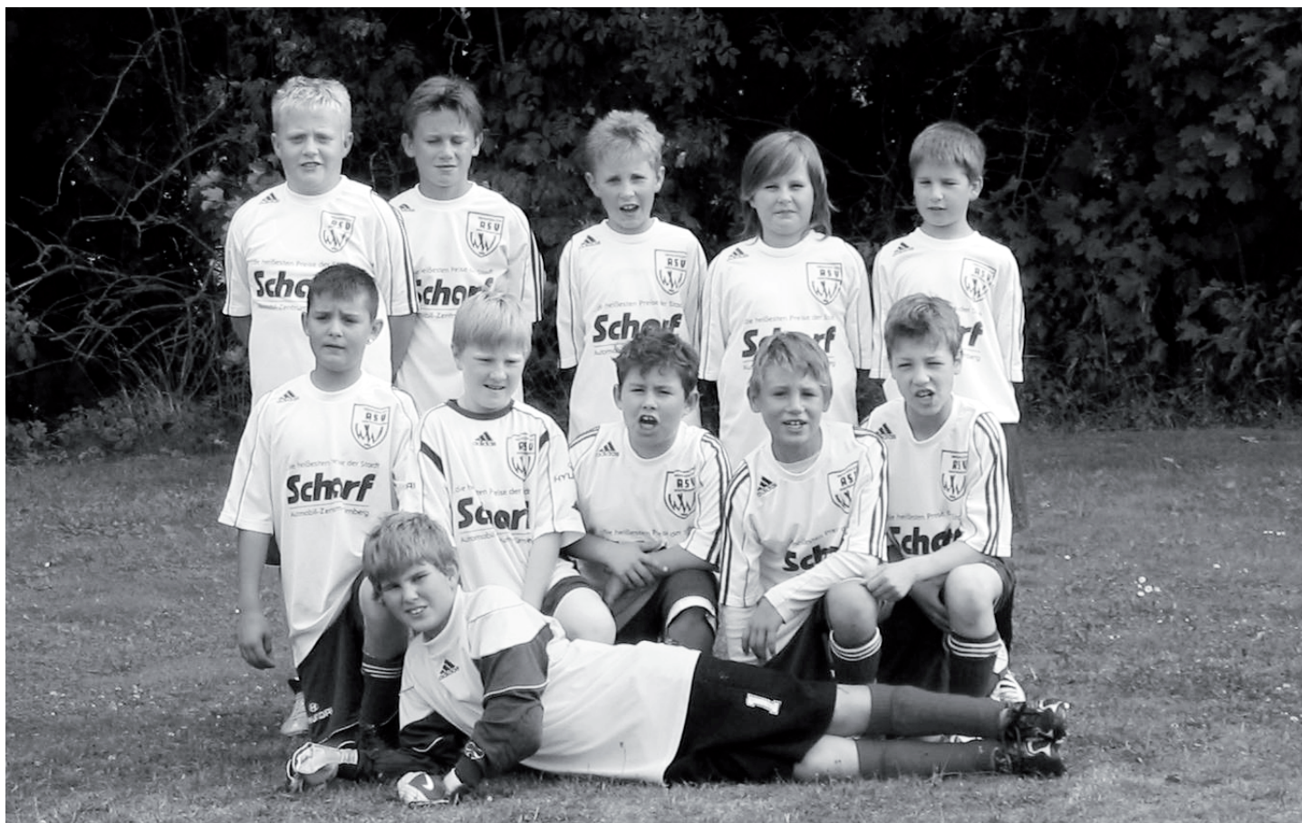
E2-Jugend in der Saison 2007/08

Hallo Sportkameraden, ein paar Zeilen zur E2 Jugend.