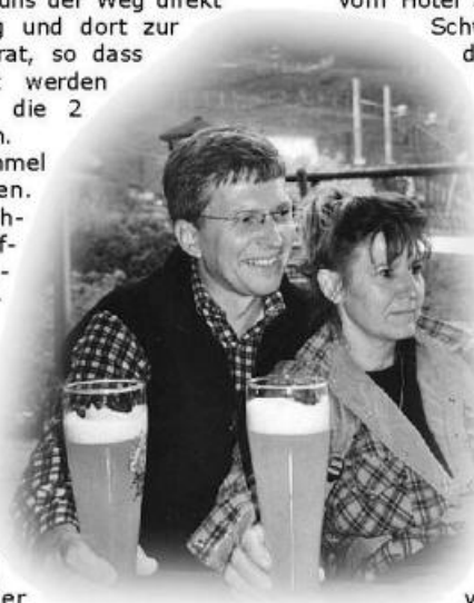
So schön kann Wandern sein ...

vom Hotel aus über den Hoch-Schwarzenbachalm. Die die Biere vom Abend konnten. Bei warmer Stunden Rast auf