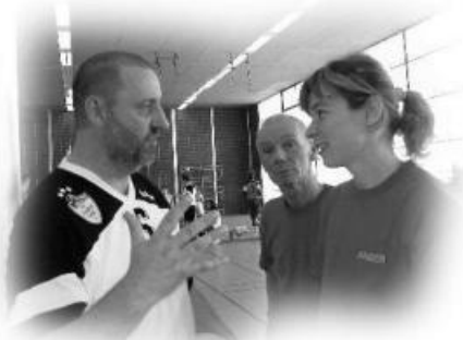
Wilde Diskussionen und Erklärungsversuche bei Schiedsgericht und Turnierleitung