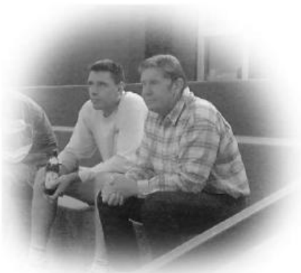
Bier-Experten ..... bei ihren Spielbeobachtungen

Auch am letzten Spieltag konnten wir uns behaupten und beendeten die Saison 2003/2004 mit einem 3. Platz in Gruppe A Mittelfranken - wer hätte das am Anfang der Saison von einem Aufsteiger erwartet - dies bedeutet außerdem, dass wir zum 4. Mal in den 10 Jahren unserer Teilnahme an der Mixedrunde des Bayerischen Volleyballverbandes zu den 12 besten Teams in ganz Bayern gehören! Und einen weiteren Spielball dürfen wir unser Eigen nennen. Auf gehts in die nächste Saison !!!